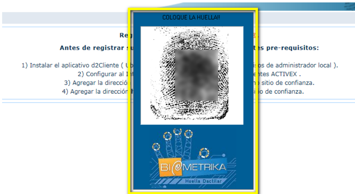
Visualización de captura de huella en nuevo componente d2Cliente.