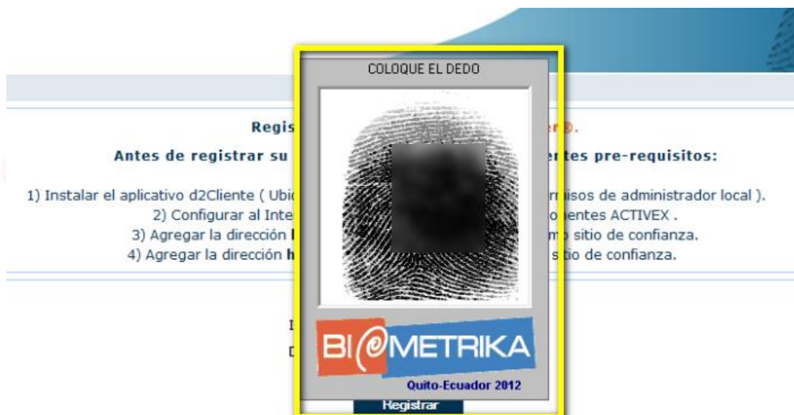
Visualización de captura de huella en componente d2Cliente actual.

Si la validación de huella, KIT es correcto, el proceso se habrá completado correctamente. En caso de visualizar mensajes diferentes se debe referir a los manuales entregados en la primera versión de la plataforma NServer.